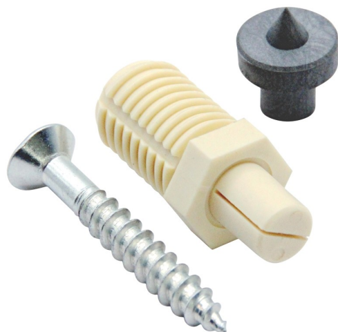
Фото и чертеж изделия